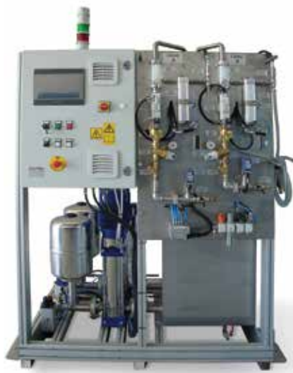
Sistema de doble circuito

Algunos ejemplos de equipos y sistemas hechos a medida son: